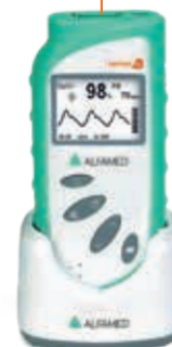
Aparelho completo com base e capa siliconada